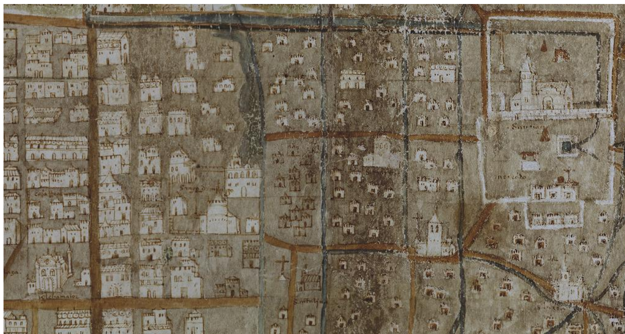
Fig. 3 Detalle del Mapa de Uppsala con la iglesia de Tlatelolco a la derecha.

La riqueza del detalle en el mapa y los símbolos y códigos aztecas parecen indicar que fue dibujado en México por uno o varios mexicas con educación española. El Mapa de Uppsala no es ni un típico mapa azteca, ni uno español, lo cual lo hace único en su género. Uno de los detalles más llamativos y reveladores es el tamaño desproporcionado de la iglesia de Tlatelolco, que aparece en el mapa como el edificio más grandioso de todos, inclusive cambiándose su posición en la plaza (Fig. 3).