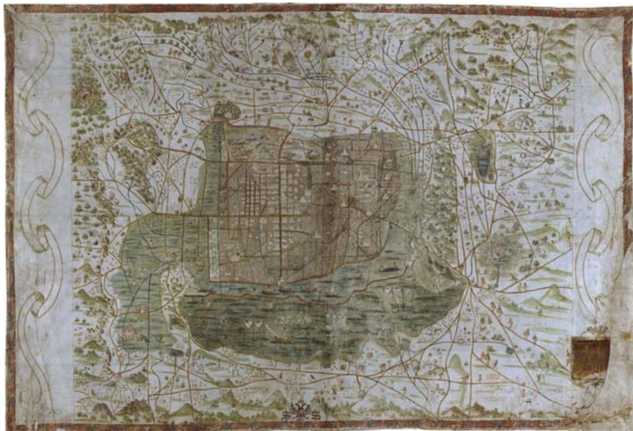
Fig. 2 Mapa de Uppsala.

Hecho en pergamino, tiene un tamaño de 75 cm de alto x 114 cm de ancho. Realmente está pintado en dos hojas, aproximadamente del mismo tamaño, unidas verticalmente en el centro. No está a escala y la persona que lo dibujó no tenía conocimientos de triangularización. Muestra caminos, edificios y canales. La ciudad no está desierta sino llena de vida, con hombres trabajando, animales y plantas. También es rico en símbolos, tanto españoles como aztecas. Los edificios y templos más importantes están indicados con su nombre.